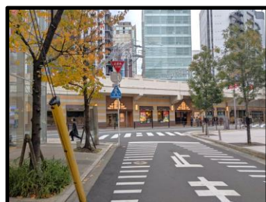
突き当たりがかっぱ横丁