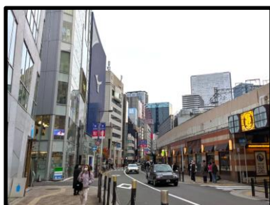
奥に「ミズノオオサカ茶屋町」