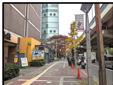
梅田ロフト駐車場前